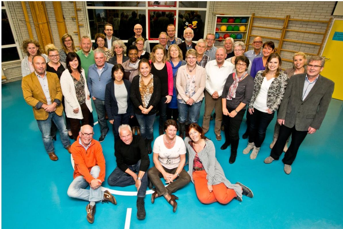
Mentoren School's Cool Westland